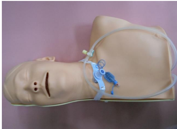
・吸引訓練モデル 1体