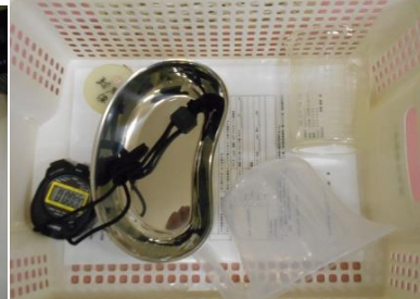
・経管栄養用具一式 1式