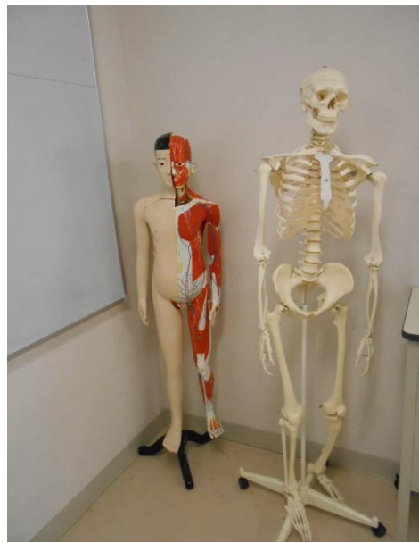
・人体解剖模型 1体