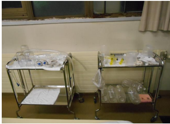
・処置台又はワゴン 1台