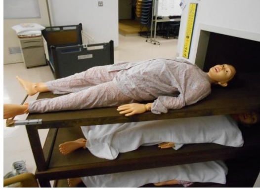
・心肺蘇生訓練用器材一式 1式