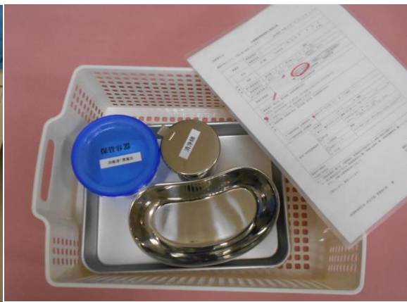
・吸引装置一式 1式