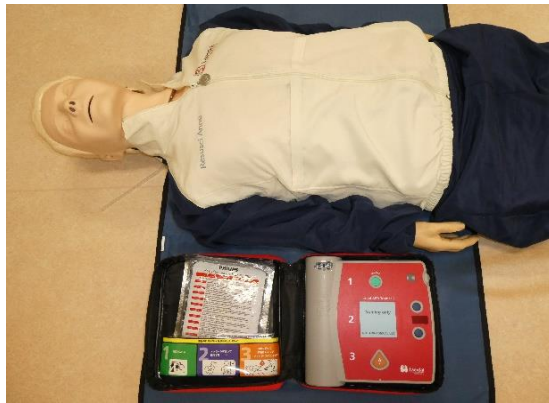
・心肺蘇生一式 1式