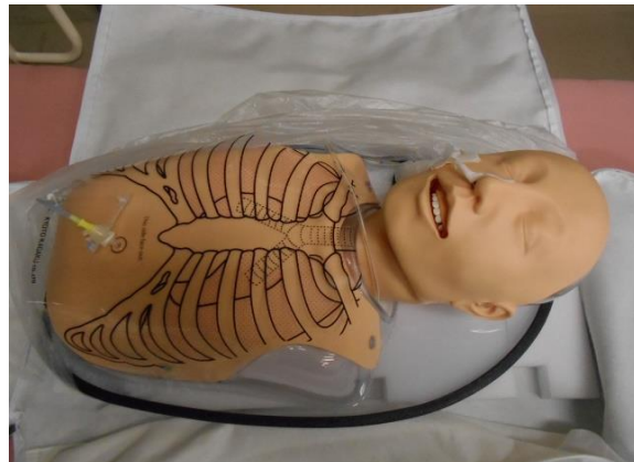
・経管栄養訓練モデル 1体